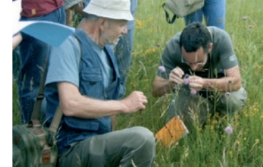
Gestion et développement du paysage